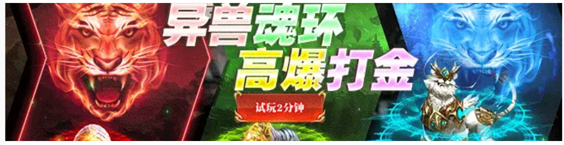
白虎高爆·效卓 广告